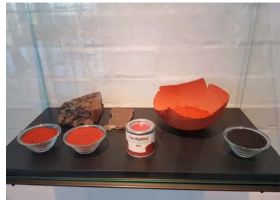
Falu Rödfärg – das typische „Schwedenrot“

Weltberühmt ist das rote Farbpigment, ein Nebenprodukt des Bergbaus, welches bis heute zahlreichen Holzhäusern in Schweden den typisch roten Anstrich verleiht. Ende des 20. Jahrhunderts wurde der Bergbau eingestellt, das Gelände gilt heute als eines der wichtigsten Touristenziele in Schweden.