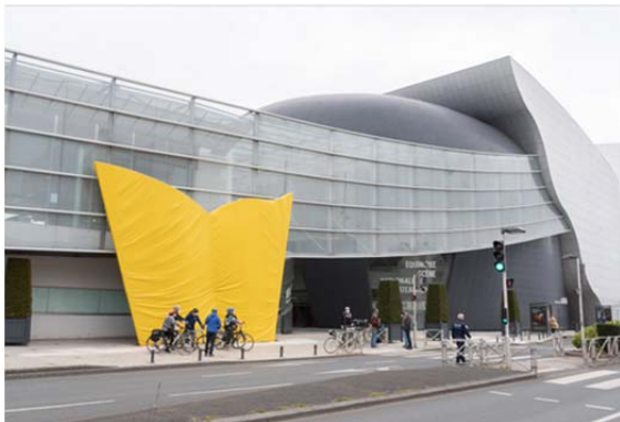
Tour de France-Farblecks vor dem Theater in der französischen Partnerstadt

Der Countdown läuft: In zwei Monaten startet die diesjährige Tour de France. Für die Zielankunft der 6. Etappe in Châteauroux am 1. Juli 2021 laufen die Vorbereitungen auf Hochtouren. In der Hauptstadt des Département Indre sind bereits mehrere Stellen mit den Farben der markanten Tour-Trikots dekoriert.