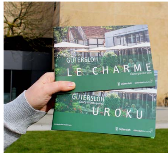
Die übersetzten Stadtbroschüren in französischer und polnischer Sprache sind ab sofort erhältlich.

In gedruckter Form sind die beiden Broschüren, neben der deutschen und englischen Ausgabe, auch bei der Gütersloh Marketing erhältlich.