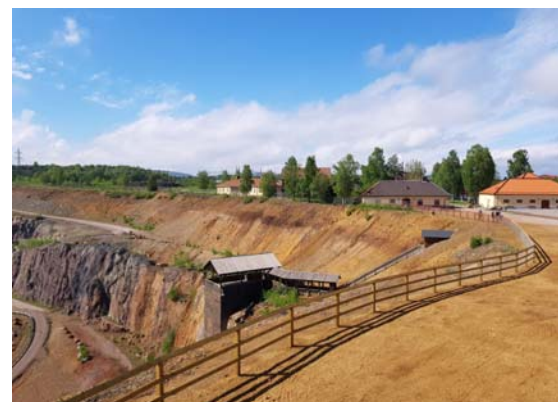
Das ehemalige Bergwerksgelände in Falun.

Anlässlich des besonderen Welterbe-Jubiläums ist im Juni 2021 die Eröffnung einer neuen Open-Air-Ausstellung auf dem Museumsgelände in Falun geplant.