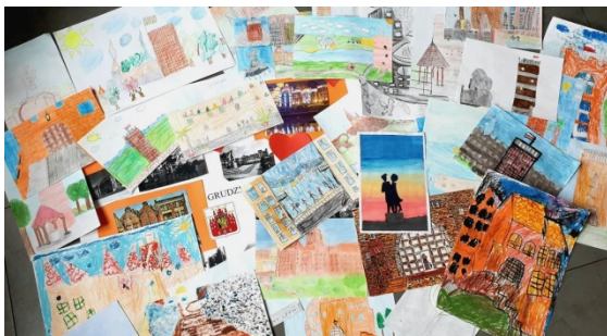
„I love Grudziądz“ - Kunstwettbewerb für Kinder