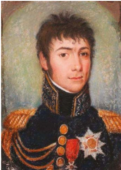
Ein Vertrauter Napoleons I.: General Bertrand

Am 5. Mai jährt sich in diesem Jahr der Todestag von Napoleon I. zum 200. Mal. Aus diesem Anlass hat Frankreich für 2021 das „Année Napoléon“ („Napoleonjahr“) ausgerufen. Auch die Gütersloher Partnerstadt Châteauroux ist mit dem französischen Kaiser verbunden. General Bertrand, ein enger Vertrauter von Napoleon Bonaparte, wurde in der französischen Stadt geboren und starb ebenda.