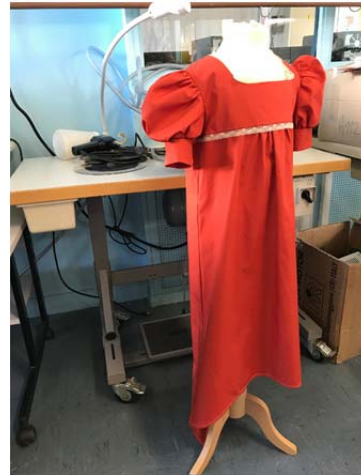
Anfertigung eines Kostüms aus der Zeit Napoleons.

Anlässlich des 200. Todestages Napoleon I. eröffnet das Bertrand-Museum in Châteauroux im Juni eine Ausstellung mit dem Titel „Napoleon-Bertrand - Die Rückkehr der Helden“. Dafür fertigen derzeit Schüler der lokalen Berufsschule „Les Charmilles“ 20 Kostüme aus der Epoche Napoleons an.