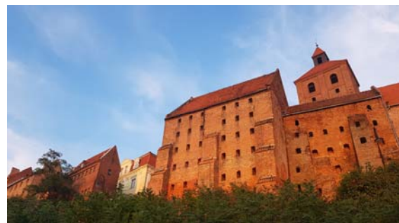
Wahrzeichen von Grudziądz: Speicher der Altstadt

Infolgedessen erlebte die Stadt eine erste Blütezeit und entwickelte sich im 14. Jahrhundert zu einem Zentrum des Getreidehandels. Zu dieser entstanden auch die ersten Speicherbauten, die noch heute das eindrucksvolle Stadtbild von Graudenz prägen.