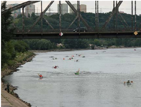
Kajaktour auf der Weichsel