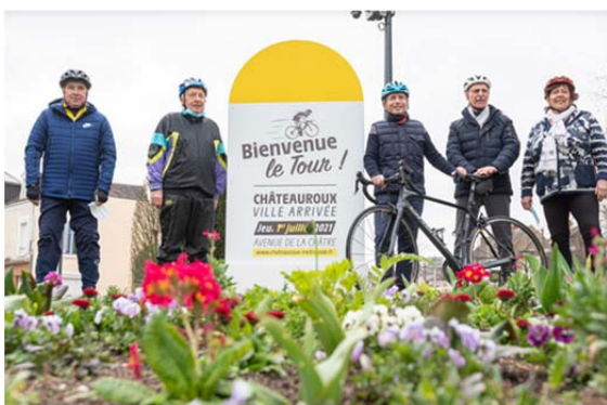
Teilnehmer der Radtour durch Châteauroux

Zusammen mit dem Präsidenten des Département Indre, Serge Descout, unternahm Gil Avérous, Bürgermeister von Châteauroux und Präsident von Châteauroux Métropole eine Radtour entlang der Strecke, die am 1. Juli befahren wird.